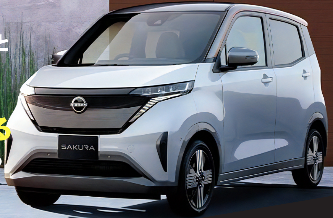
*画像は日産自動車「SAKURA」